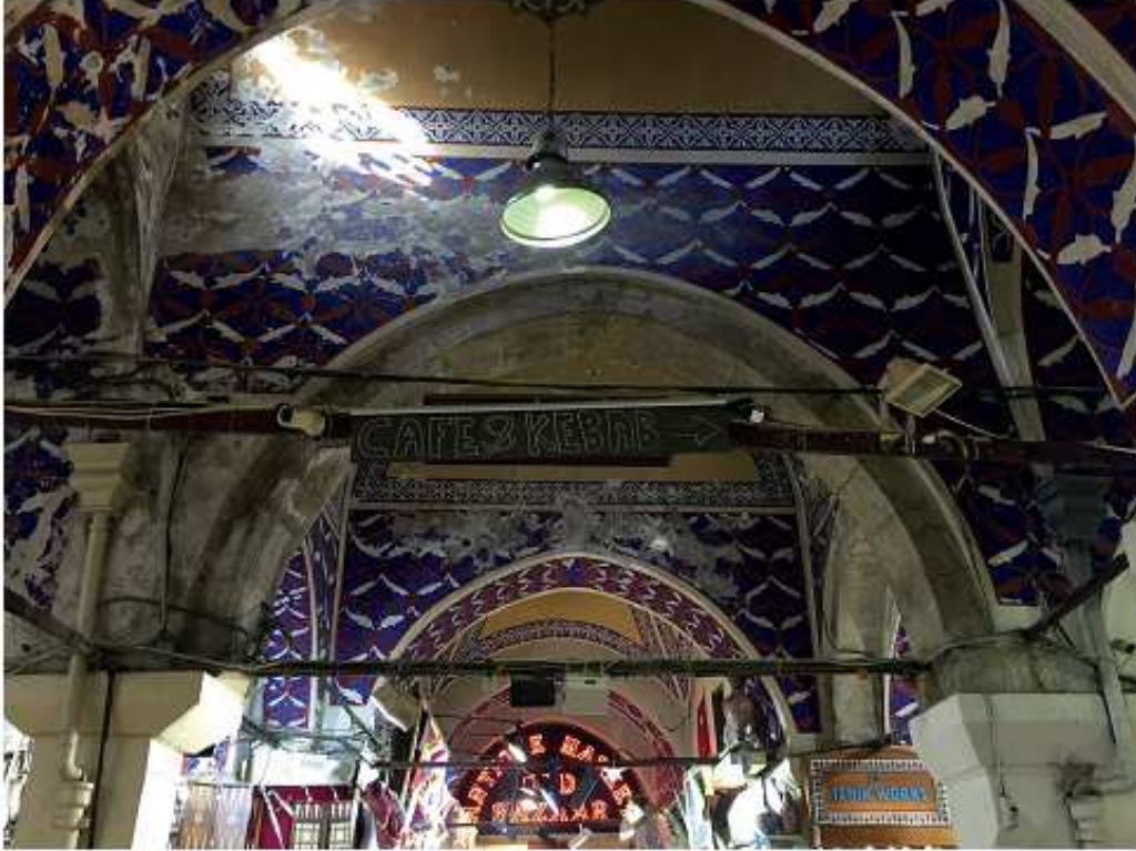
Fotoğraf 6. İstanbul/Beyazıt/ Kapalıçarşı/ Bilgilendirme Tabela tasarımı (Beyazıt, 2020)

Kapalıçarşı (Grand Bazaar)'da gezildiğinde uygun olmayan tabelalarla sürekli karşılaşmaktayız. Örnek olarak Fotoğraf 6'daki tabela anlaşılır olmayıp sadece "cafe&kebab" yazılıp okla gösterilmiştir. Bu kadar önemli tarihi bir çarşıda böyle tabelalar inanılmaz derecede tarihi çarşıya zarar verip olumsuz etkilemektedir. Tabelada kastedilen kafenin ne bir markası nede bir ismi vardır. Bu kadar mimari ve tarihi ve kültürel değerlere sahip olan mekana böyle tabelalar yönlendirme ve bilgilendirme yapmadıkları gibi bu tarihi ve değerli yapıya da uygun olmamaktadır.