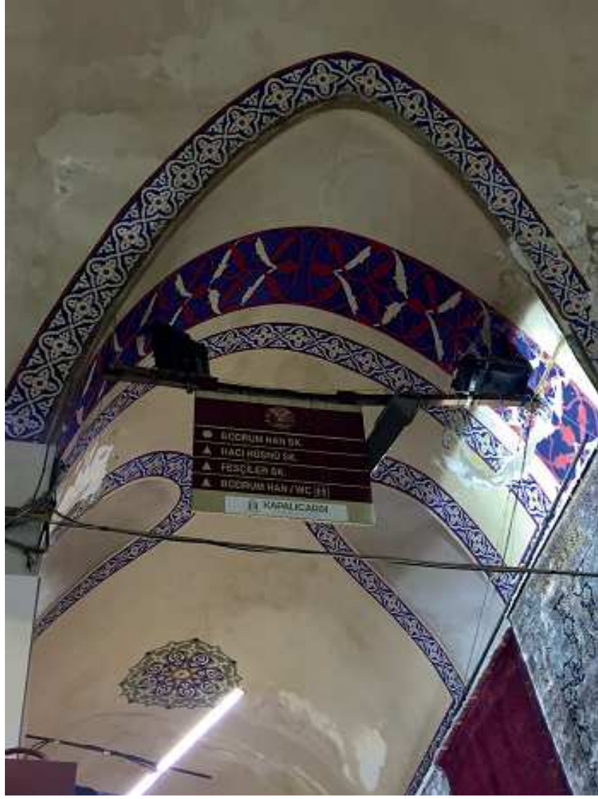
Fotoğraf 3: İstanbul/Beyazit/ Kapalıcaři/ Bilgilendirme Tabela tasarımı (Beyazit, 2020)

Fotoğraf 3'te ara sokaklarda, her yerde stabil bir şekilde aynı tabelanın sürekli tekrarlanması ve uygun olmayan aynı font'u kullanmaları görüntü kirliliği sağlamaktadır. Tarihi yapıya uygun olmaması, çarşının tarihi mimarı ve şeklini bozmakta olup görülmeyen yerlerde asılmıştır. Tabeladaki kullanılan renkler karanlık olup okunması daha zorlaşmıştır. Tabelaların, alt alta ve farklı yönlendirmeleri de bir diğer yanlışlıktır.