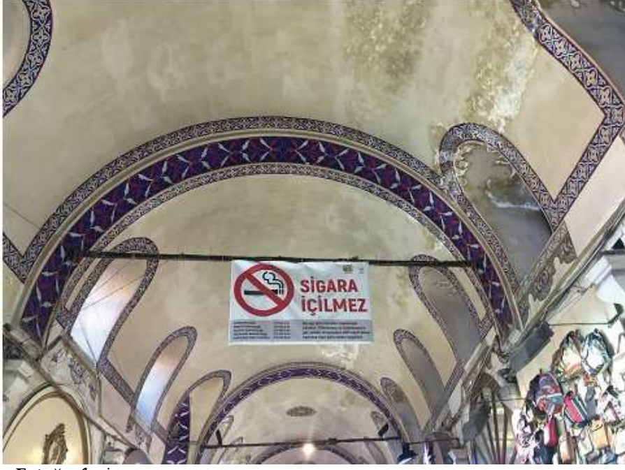
Fotoğraf 4: İstanbul/Beyazıt/ Kapalıçarşı/ Bilgilendirme Tabela tasarımı (Beyazıt, 2020)

Fotoğraf 4'te bir tarihi mekanda sigara içilmez yazısı ve bunu basit bir baskıyla asmaları görüntü kirliliğine sebep olmuştur. Bir tarihi mekanda sigara içilmez yazısı bile hem kalite hem de tasarım açısından uygun bir tabelada olmalıdır, tabelanın font, renk ve tasarımı tarihi çarşıya göre uygun bir şekilde özel tasarlanmalıdır.