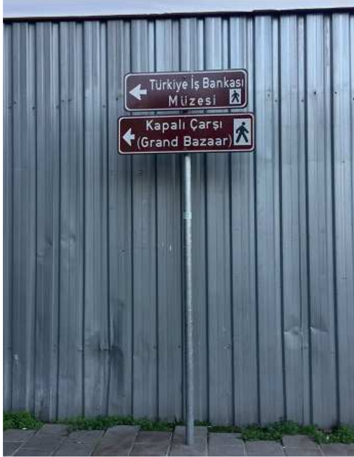
Fotoğraf 1: İstanbul/Beyazıt/ Kapalıçarşı/ Bilgilendirme Tabela tasarımı (Beyazıt, 2020)

Aşağıda fotoğraflarla yanlış bilgilendirmeler açıklanmıştır: