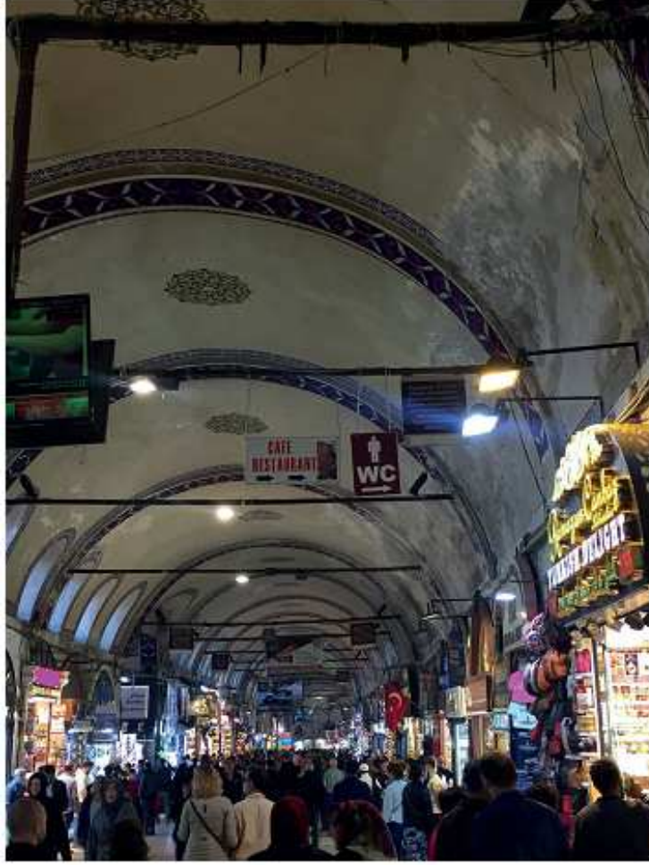
Fotoğraf 7: İstanbul/Beyazıt/ Kapalıçarşı/ Bilgilendirme Tabela tasarımı (Beyazıt, 2020)

Fotoğraf 7'de tabelalar uyumsuz bir şekilde asılmıştır. Birisinde "cafe&restaurant" yazısını görmekteyiz. Yanındaki "WC" yazısı ve üçüncü de ne yazıldığı okunmamaktadır. Tabelalar küçük, estetik olmayan tasarımı, tabela materyalinin yanlış seçilmesi yine kullanılan bu ortak tasarım dili tarihi dokuyu yansıtmamaktadır. Bu durum algı sorunu ortaya çıkarmakla birlikte çarşının tarihi dokusunda görsel kirliliğe neden olmaktadır. Ayrıca çarşının estetiğini de olumsuz etkilemektedir ayrıca yazması anlam karmaşası oluşturmakta ve dil bütünlüğünü bozmaktadır. Metal çerçeve ve ayaklardan oluşan tasarım çatıdan asılmıştır ve eğik bir şekilde durmaktadır.