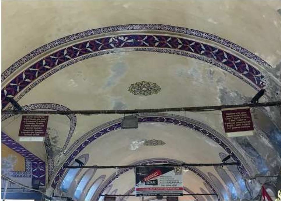
Fotoğraf 5: İstanbul/Beyazıt/ Kapalıçarşı/ Bilgilendirme Tabela tasarımı (Beyazıt, 2020)

Fotoğraf 4'te bir tarihi mekanda sigara içilmez yazısı ve bunu basit bir baskıyla asmaları görüntü kirliliğine sebep olmuştur. Bir tarihi mekanda sigara içilmez yazısı bile hem kalite hem de tasarım açısından uygun bir tabelada olmalıdır, tabelanın font, renk ve tasarımı tarihi çarşıya göre uygun bir şekilde özel tasarlanmalıdır.